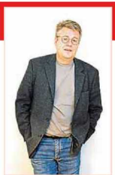
Stieg Larsson va morir el 2004.

UN FENÒMEN DE VENDES 'Els homes que no estimaven les dones' i 'La noia que somiava amb un llumí i un bidó de gasolina' han despatxat ja 10 milions d'exemplars per tot el món.